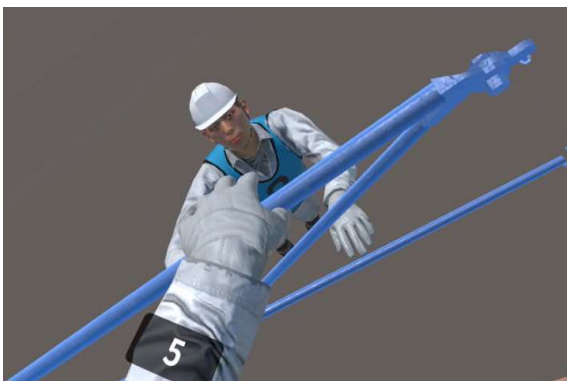
足場機材を掴める場合に青く光る