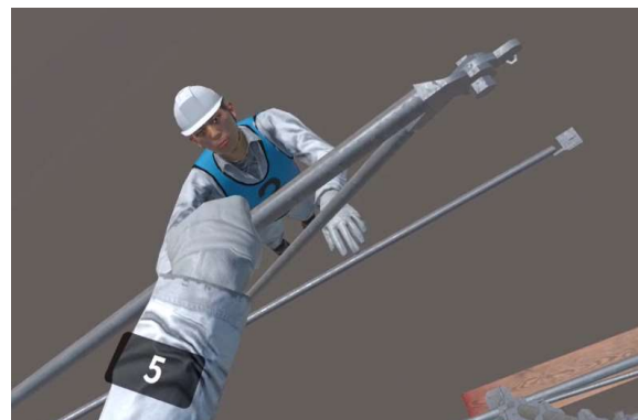
⇒ 正しく掴んだら色が消える