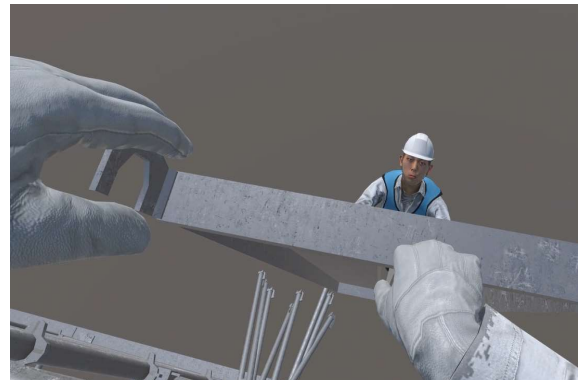
⇒ 受け取る側の受講者はこの様に見える